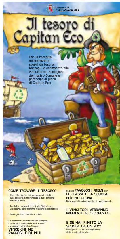
Capitan Eco... in cattedra al Conventino

Le ecomonete, consegnate presso la propria classe, potranno essere collocate nei capienti salvadanai distribuiti. Le classi e la scuola che al termine del gioco avranno raccolto più monete saranno proclamate le più ricicloni e vinceranno favolosi premi. Sono previsti comunque gadget per tutti i partecipanti.