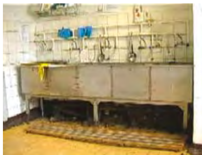
Alcune, significative immagini dello stato in cui versa la cucina dell'orfanatrofio