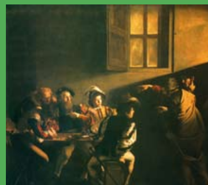
La Vocazione di San Matteo, il clone che arriverà a settembre

Come ad ogni celebrazione, la fine dell'intento e dell'evento spegnerà evidentemente i riflettori. Non