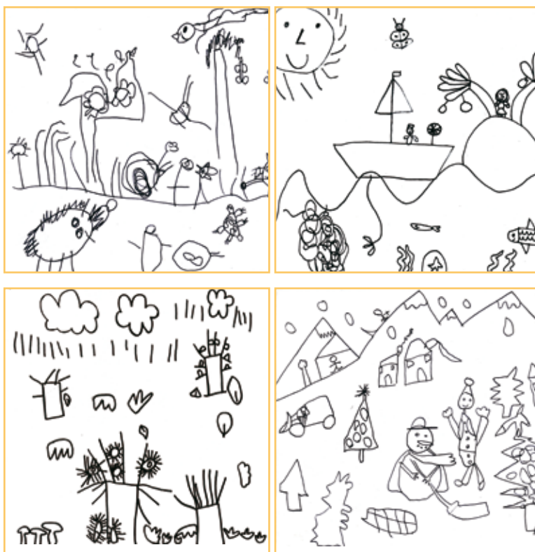
I quattro disegni dei bambini della Margheritina che illustrano le stagioni del calendario realizzato a scopo benefico.

Un grazie particolare va alla generosità dei genitori e parenti, alle maestre che hanno organizzato un gesto molto educativo, all'amministrazione comunale che ha patrocinato l'iniziativa e infine ai bambini stessi che a soli 3-4-5 anni si sono dati da fare con molta gioia e spontaneità, e hanno potuto sperimentare la grande forza presente in quel Bambino Gesù che nato 2000 anni fa è ancora vivo e opera fra noi, e i gesti fatti nel Suo nome splendono come educazione per i più piccoli e come esempio per i grandi!