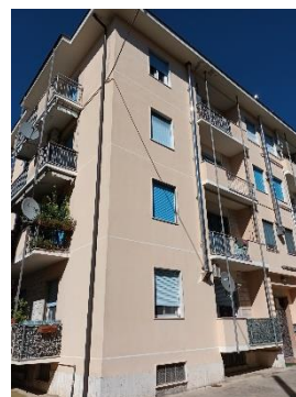
FOTO IDENTIFICATIVE BENE e PLANIMETRIA